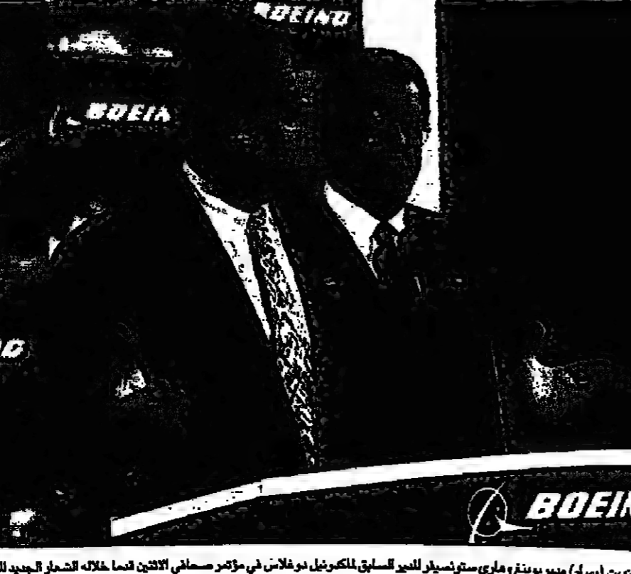
خل كويت (إس) مدير بيونغ ومباري ستينيسار للمركبات كونغولان في مؤتمر صحفي الاثنين كما خلاله التحول الجديد للشركة للتصنيع

جذبها في هذا الجانب التجاري. إذ قبل عام 1993 كانت دول الاتحاد الأوروبي هي المستورد الرئيسي، وقد فاق مجموع ما يملكه الولايات المتحدة في أوروبا الغربية من تلك الصناعات عام 1991 ما كانت باعتها لدول آسيا بقيمة مليارات دولار. وقال التقرير إن دول جنوب آسيا لم تعمل بما يكفي لتطوير اقتصادياتها، مما قد يؤدي إلى فقدانهم مركزهم، وإبقاء المنطقة محرومة من الفوائد الاقتصادية، وشيخوخة من عدم الاستقرار.